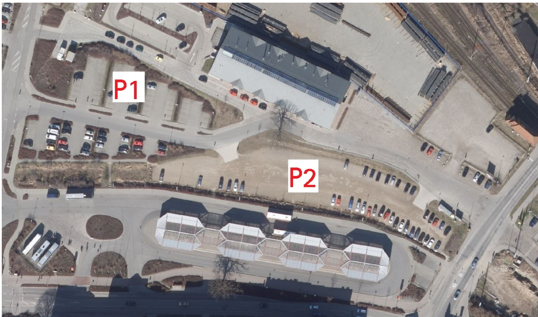
Anlage PP Altstadt/Bahnhof/ZOB